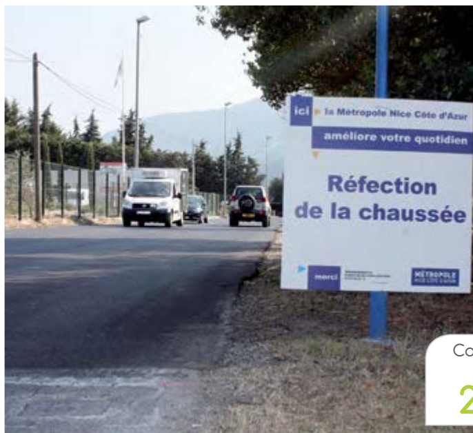
Coût des deux chantiers environ