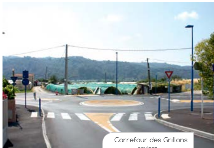
Carrefour des Grillons environ

C'est un chantier un peu similaire qui a été mené plus bas, au carrefour entre la voie d'accès au boulevard de la Colle Belle et la RM2210. Là aussi, un rond-point a fait son apparition sur la route de la Manda. Les autres caractéristiques de ce chantier sont : la mise aux normes des trottoirs, la réfection totale de la chaussée, la reprise de l'éclairage public, le remplacement de la piste cyclable de la RM2210 par un trottoir jusqu'à la rue du