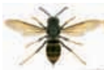
Frelon asiatique, vespa velutina