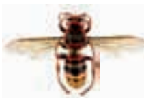
Frelon d'Europe, vespa crabro